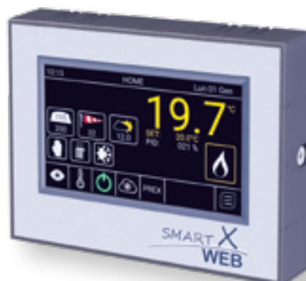
RÉGULATION Smart X

En ajustant en temps réel l'énergie la plus avantageuse, ils permettent de diminuer les dépenses tout en maintenant confort et performance.